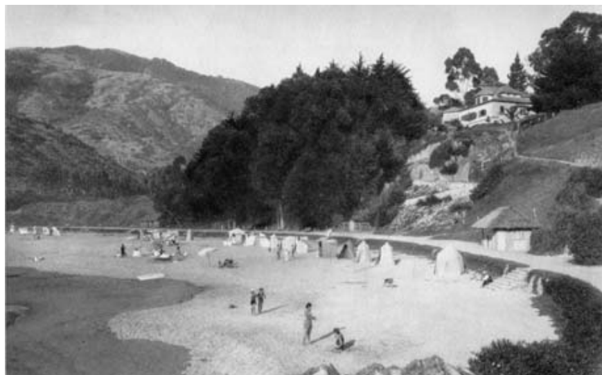
Figura 3 - Playa Zapallar (1930c).

Pero las extracciones sociales no constituyeron la única evidencia que revelaba a Zapallar como un balneario “tradicional”. Al momento de efectuarse los primeros contratos que enajenaban las propiedades de la familia Ovalle, se exigió que las residencias que se construyeran respondieran a los cánones del “buen gusto” del penúltimo cambio de siglo. An cuando el “buen gusto” no imponía ningún estilo determinante, las preferencias estéticas de las élites chilenas comprometieron la incorporación de la arquitectura pintoresquista, bávara y