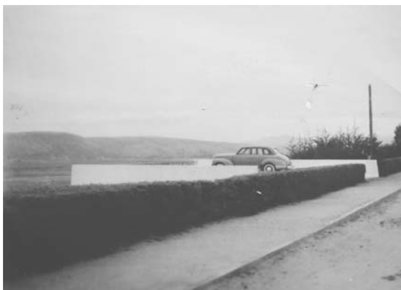
Figura 6 - Vista de la urbanización en Santo Domingo (1945).