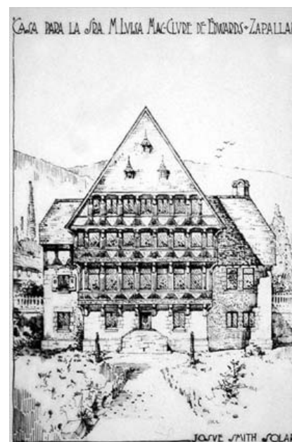
Figura 1 - Casa María Luisa Mac-Clure en Zapallar. Arquitecto Josué Smith Solar (1924)

Hacia 1900, las élites hacendadas y los más enriquecidos comerciantes de proveniencia anglosajona valoraron el ocio como una efectiva herramienta que los convertiría en lo que Thorstein Veblen denominó la "clase ociosa" (Veblen, 1995:43-74 y Barros y Vergara, 1978:41-55). Ese