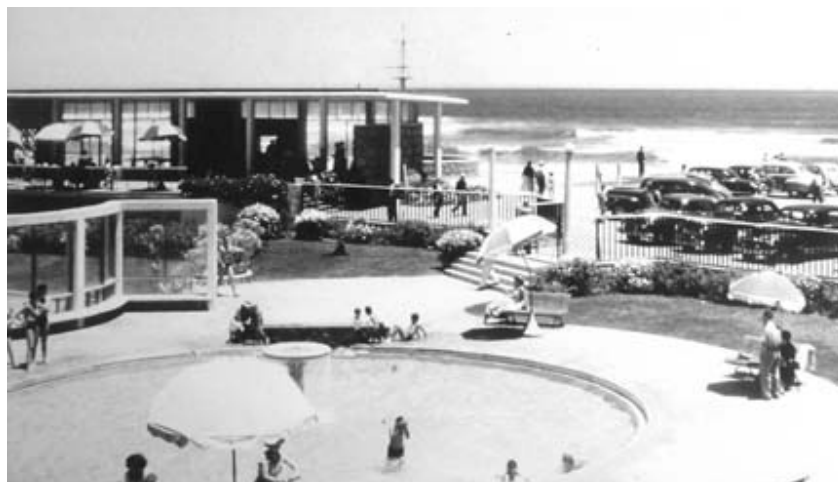
Figura 7 - Casa de Guillermo Andwarter en Rocas de Santo Domingo (vista desde la calle). Arquitectos: Valdés-Castillo-Huidobro (1945).