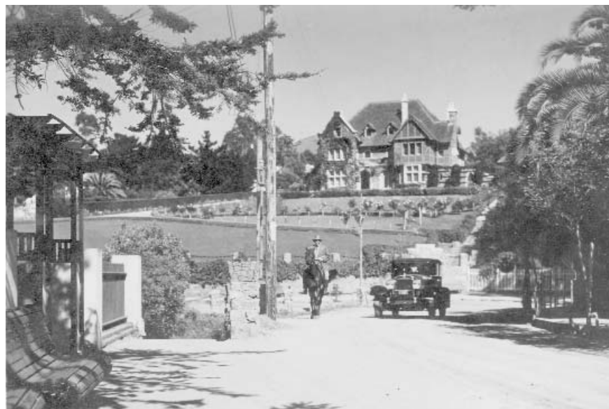
Figura 2 - Casa en Zapallar (1935c)

Posteriormente, la dictadura modernizadora de Carlos Ibáñez del Campo (1927-1931) se comprometería en la difusión de nuevos destinos y sería el primer gobierno nacional en incentivar la instalación del negocio turístico en el país. Ibáñez regularía el funcionamiento de