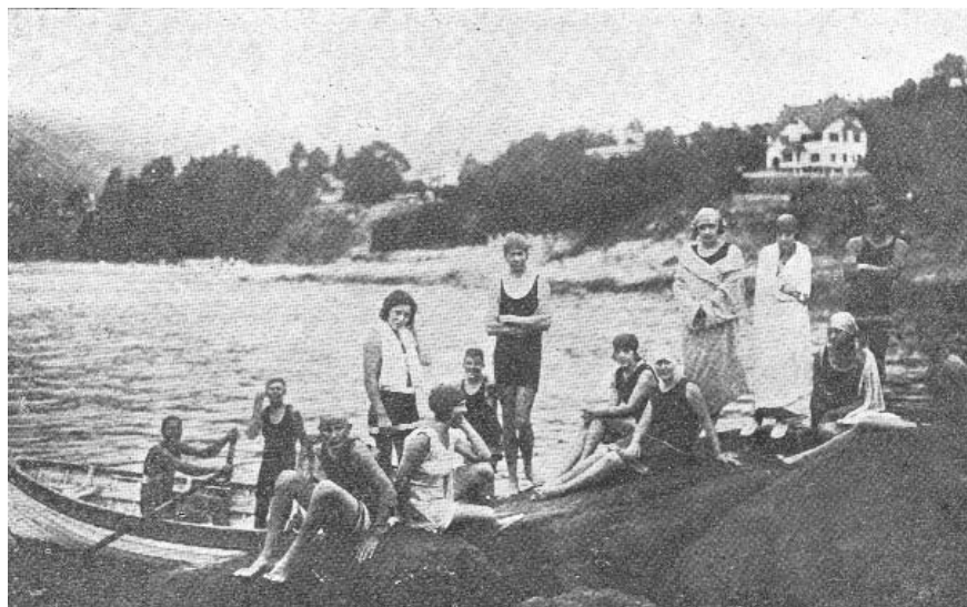
Figura 4 - Jóvenes bañistas en Zapallar. Cartón postal (1940c).